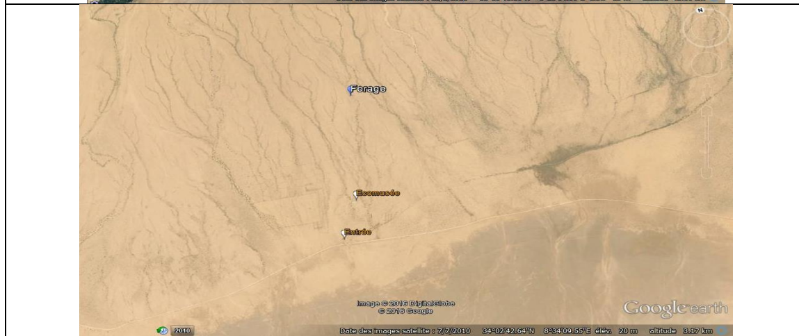
carte de localisation des interventions