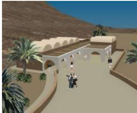
Station de Guermassa à Ghomrassen