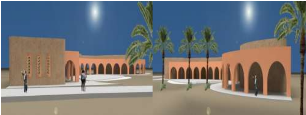
Station Sabriya (Kébili)