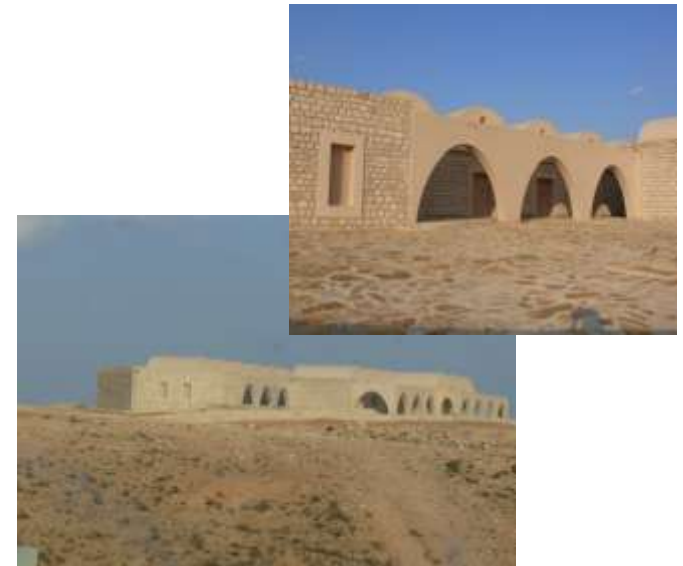
Station de Tamazret à Matmata