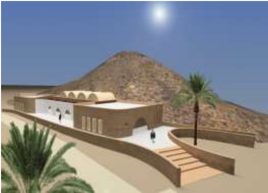
Station d'El Gtar, gouvernorat de Gafsa