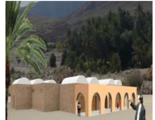
Station de: Mides (Tozeur)