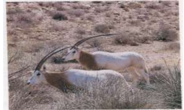
Antilopes oryx dammah